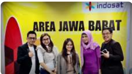
INDOSAT AREA JAWA BARAT