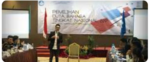
DUTA BAHASA NASIONAL