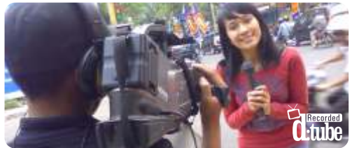
Class of TV Presenter