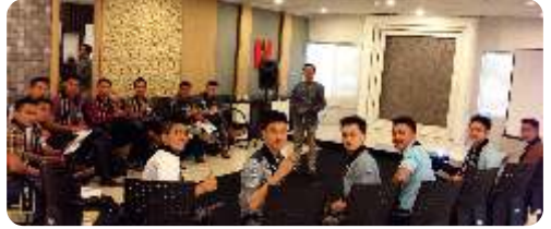
NUTRIFOOD - LMEN OF THE YEAR