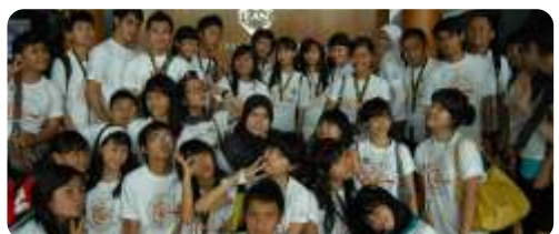
Study on Location Trans-TV