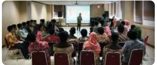
DITJEN PAJAK TRAINING