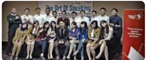
THE ART OF SPEAKING BANK BJB