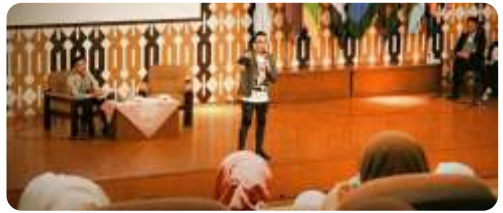
Kepelatihan Public Speaking on Campus