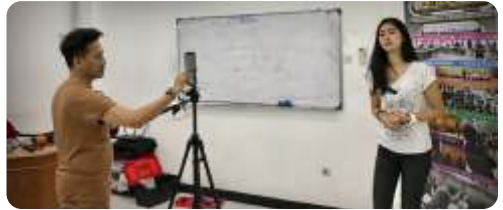
Belajar Teknik Presentasi

Creating Content for Youtube. Disini siswa diajarkan mengali konten - konten youtube yang digemari, sekaligus dicoba untuk divideokan dan di upload ke channel youtube masing - masing