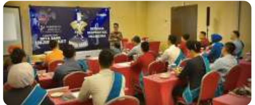
DUTA BANK NASIONAL