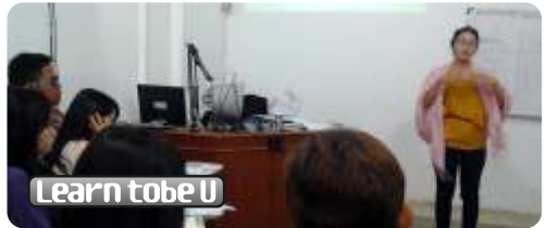
Public Speaking Training